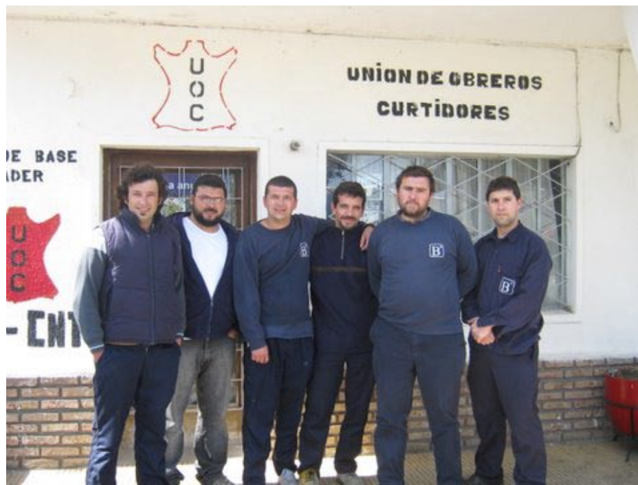
Directiva del Comité de Base de la fábrica Bader.