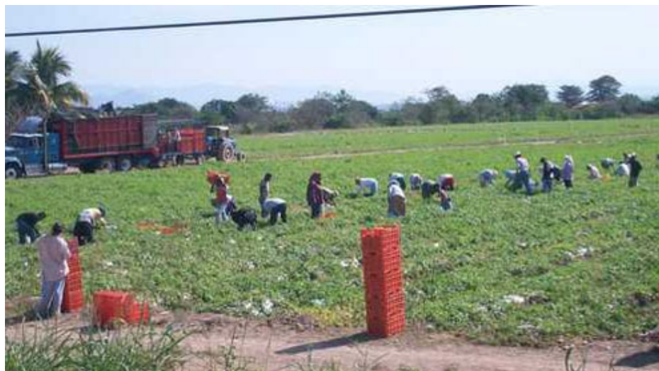
Departamento Jurídico del Pit-Cnt