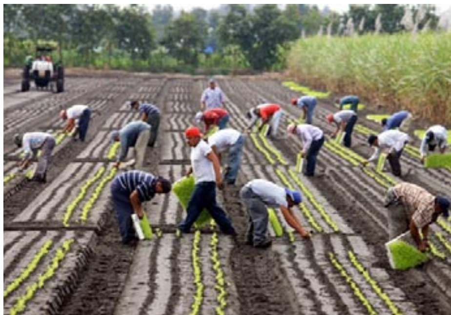
Departamento de Salud Laboral y Medio Ambiente

Art. 5.- Compete a la Inspección General del Trabajo y de la Seguridad Social controlar la efectiva aplicación de la presente norma y deberá