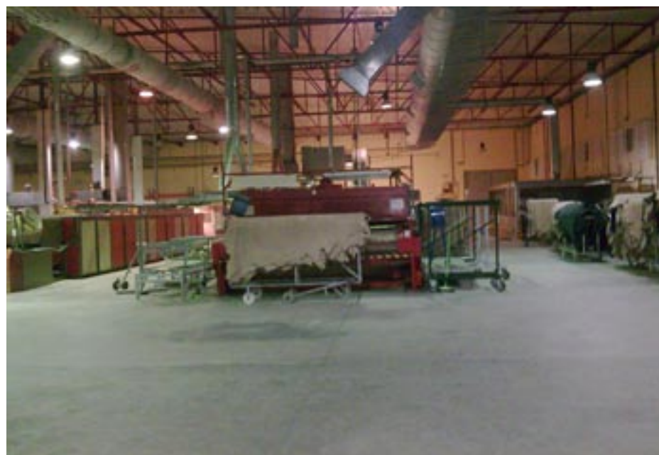
Sección terminación cueros salientes de la máquina de pintar llamada TTH