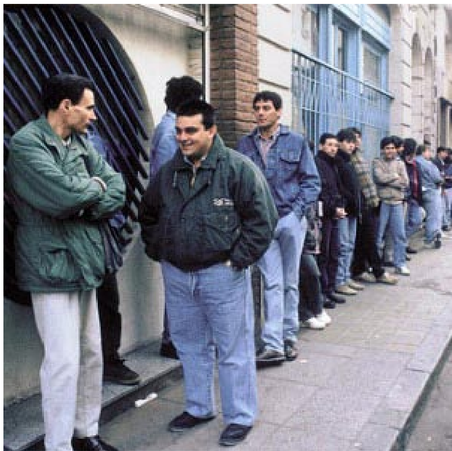
Equipo de Investigación del Instituto Cuesta Duarte PIT CNT