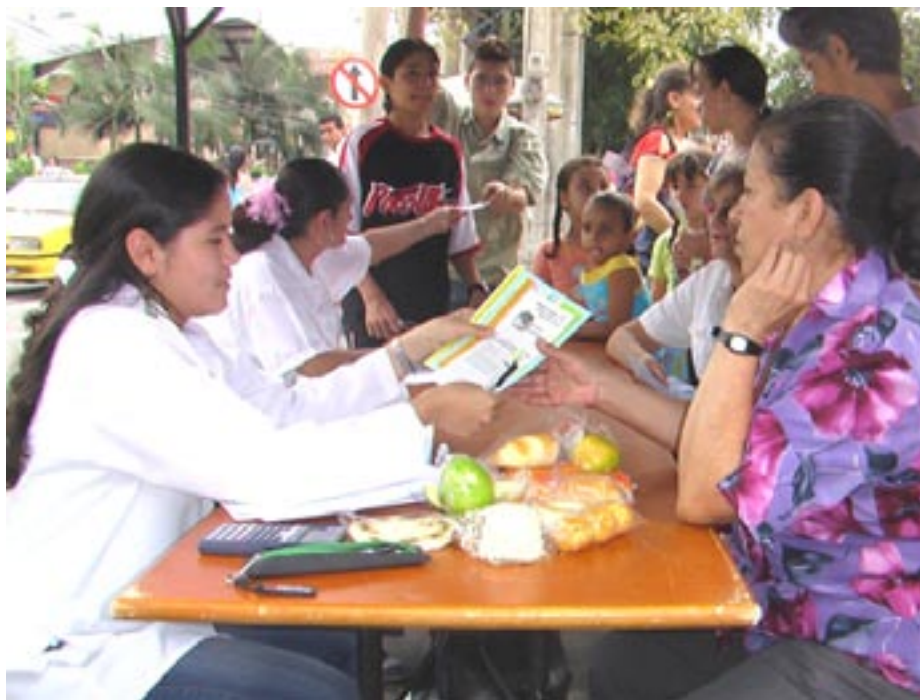
Representantes de los Trabajadores en la Ju.Na.Sa

El ejercicio del derecho a la salud debe concebirse como un instrumento de ciudadanía activa. La participación en este caso es un objetivo en sí mismo, que implica un proceso de desarrollo de una conciencia crítica, y de gestación-adquisición de poder.