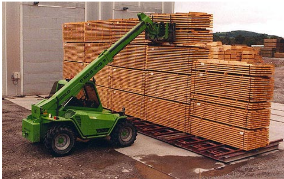
Sindicato Obrero de la Industria de la Madera y Anexos - Filial PIT CNT

Seguramente, también en la Industria de la Madera, puede existir algún componente de especulación, buscando réditos en medio de la crisis.