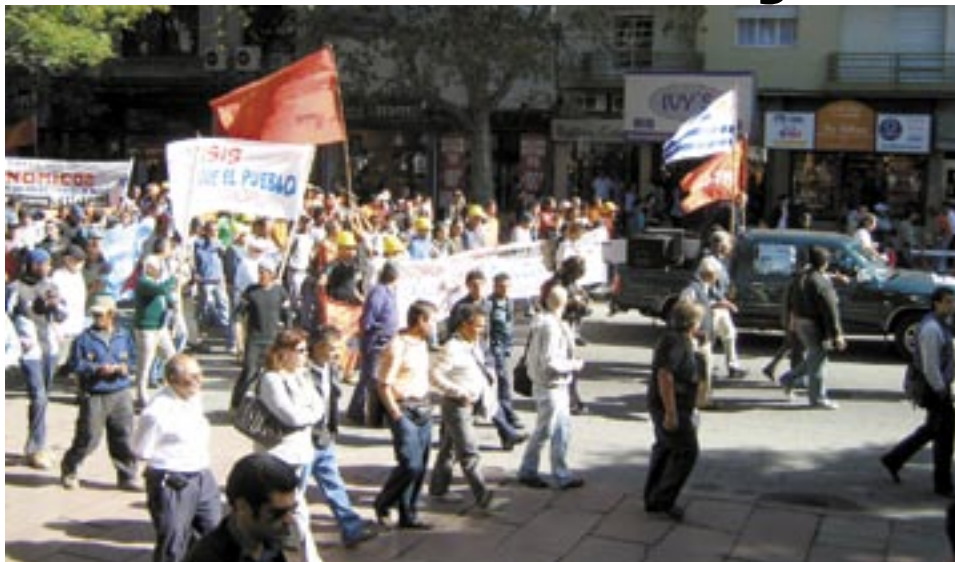
Equipo de Investigación del Instituto Cuesta Duarte - PIT CNT

Tanto a través de la política monetaria (con tasas de interés de referencia cercanas a 0) como de la política fiscal (con déficits que en algunas economías se espera que alcancen guarismos de dos dígitos en relación al producto), las economías más avanzadas aunaron esfuerzos para combatir la crisis. Sin embargo, por el momento los efectos han sido magros y la falta de confianza sigue predominando en los mercados a