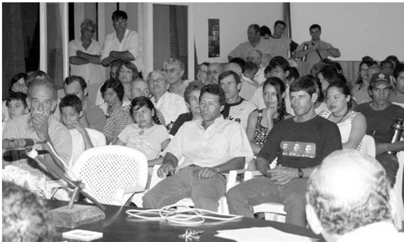
Asistentes en la presentación del Libro en la Junta Local de Bella Unión.