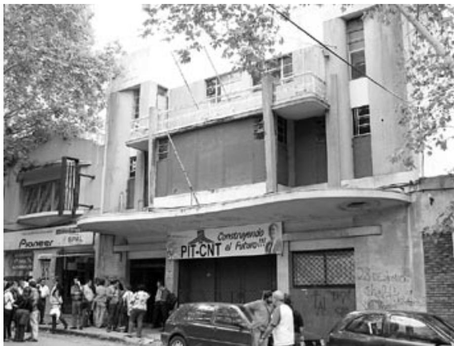
Equipo de Investigación del Instituto Cuesta Duarte PIT CNT

En este contexto, el salario real medio creció a una tasa de 4,6% anual entre 2005 y 2007, acumulando un crecimiento de 14,4% en los tres primeros años de gobierno progresista. No obstante, el salario real medio de 2007 fue aún 12% inferior a su nivel medio en 1999; y dado que para recuperar