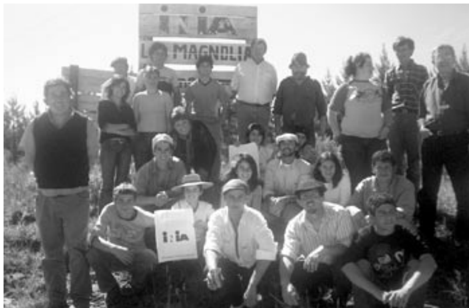
Los participantes del Curso de Ganadería en Paso Hondo, Tacuarembó visitan la Estación del INIA – Instituto Nacional de Investigaciones Agrarias.