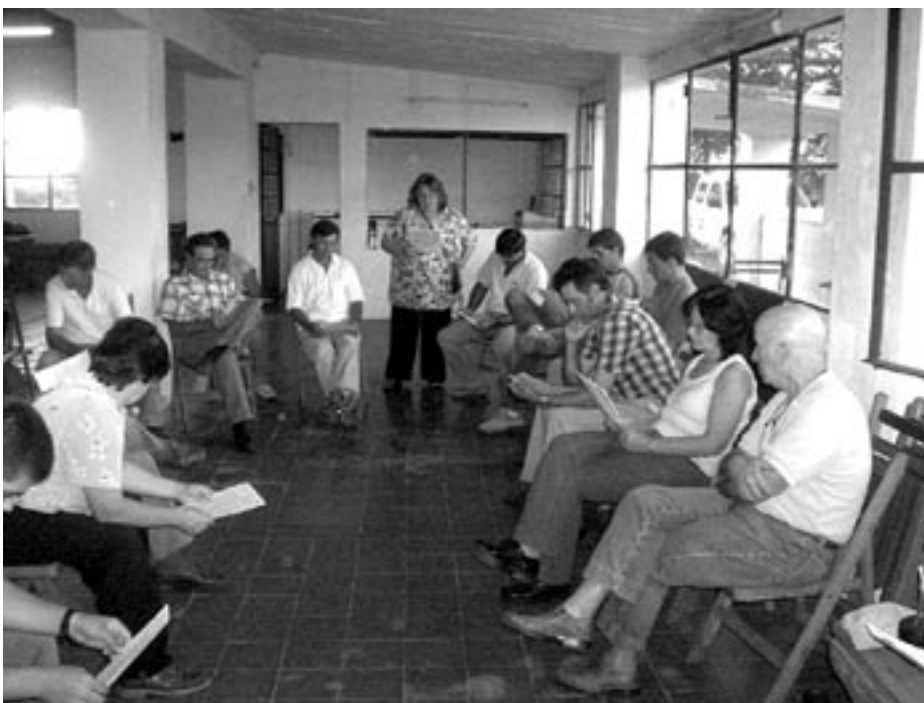
Curso de Quesería Artesanal.