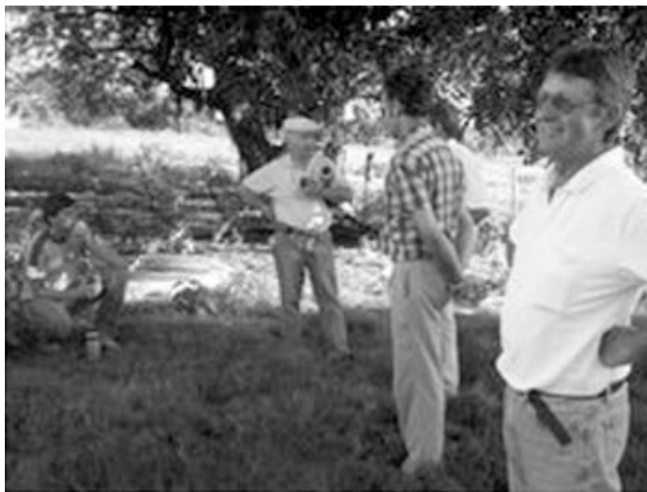
Pequeños productores participantes del Curso de Quesería Artesanal evalúan el Curso.