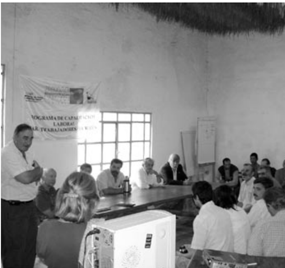
Cierre de Curso en JUMECAL, en Melilla, Montevideo rural, con la participación de trabajadores rurales, productores y Ministros de Ganadería Agricultura y Pesca, Ministro de Trabajo y Director de Montevideo Rural.