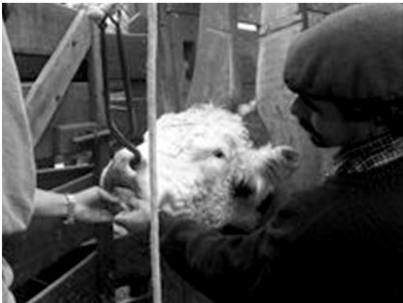
Los peones rurales de la ganadería son los olvidados de la tierra.

¿Entonces? Que esperamos para universalizar este derecho, uno de los mas elementales derechos humanos consagrado desde 1934 en la Constitución de la República: "La ley ha de reconocer a quien se hallare en una relación de trabajo o servicio, como obrero