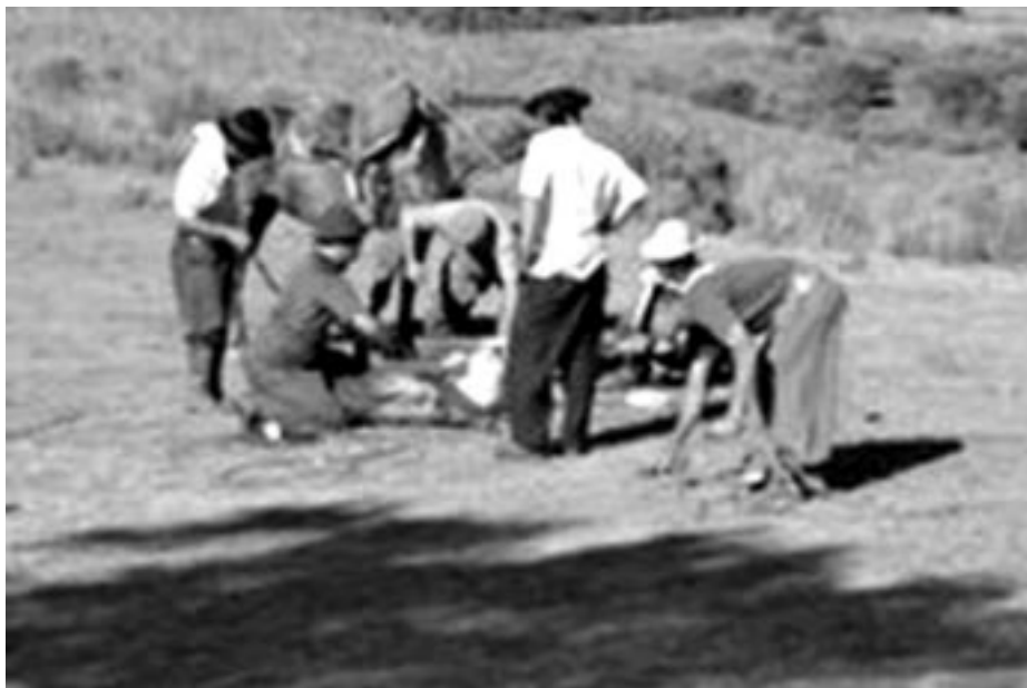
Yerra tradicional entre vecinos pobladores rurales, en Estación Laureles, Tacuarembó.

El proyecto del Poder Ejecutivo debe ser mejorado sensiblemente por el Parlamento. El régimen de 8 horas por día y 48 por semana no admite excepciones. Y no es esta una propuesta rígida porque tolera todas las particularidades del sector. Nuestra propuesta de limitación de la jornada admite que en determinadas circunstancias – por sectores y periodos - se supere el actual límite legal de