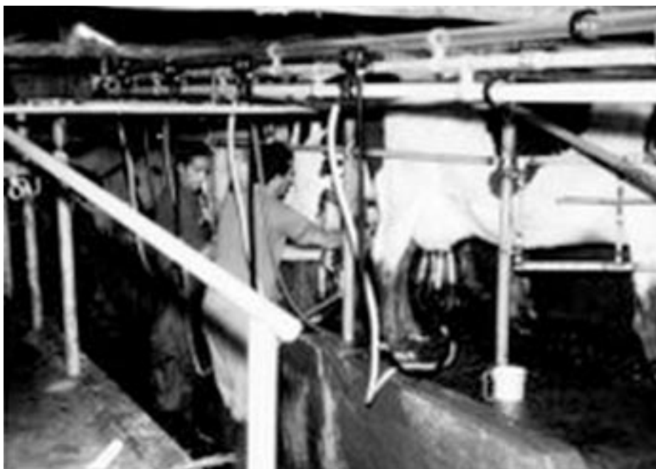
Los trabajadores de los tambos no tienen jornada de ocho horas, igual que los peones de la ganadería y agricultura. Foto: Armando Aguirre, 1972, Comunidad del Norte, Daymán Salto.

MALA, HONDURAS, EL SALVADOR: 8 horas diarias y 44 semanales