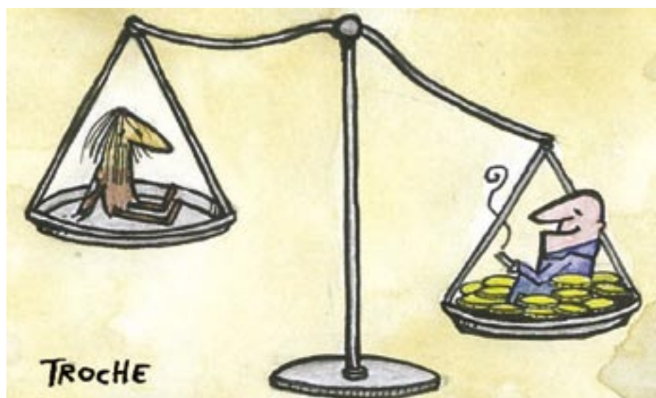
ALFREDO ZAIAT (*)

La oferta multimillonaria de 44.600 millones de dólares realizada por Microsoft para comprar Yahoo!, que fue rechazada por insuficiente, reclamando los dueños de ese otro megabuscar de Internet la suma extraordinaria de 57.000 millones de dólares, resulta