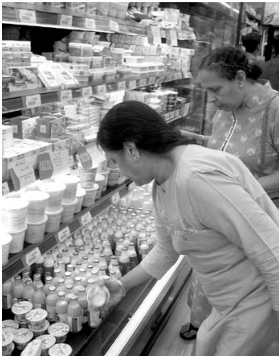
Equipo de investigación del Instituto Cuesta Duarte PIT CNT

En relación a los impuestos al consumo, la rebaja de la tasa mínima del IVA de 14% a 10% y de la tasa básica de 23% a 22% conjuntamente con la eliminación del COFIS, se esperaba que