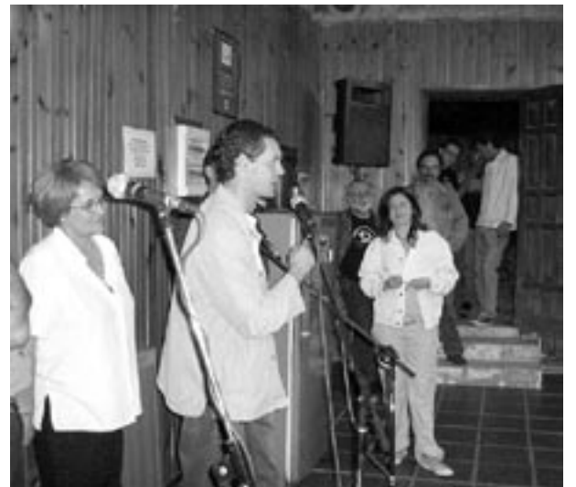
Fotos: Fin de cursos 2007, entrega de diplomas.