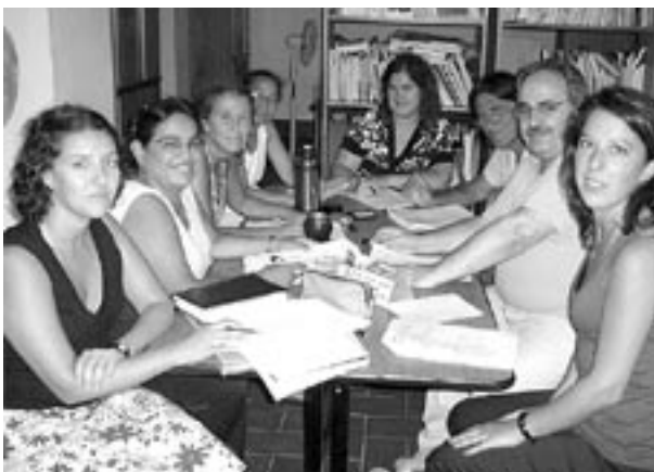
Equipo de trabajo.

Es importante remarcar que a fin de resguardar la identidad de los trabajadores encuestados, sus datos personales adquieren grado de confidencialidad.