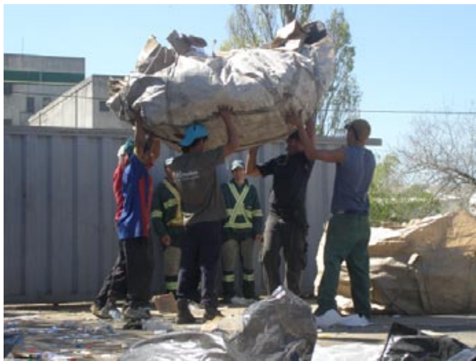
Secretaría de Salud Laboral y Medio Ambiente

... dentro de los ciento ochenta días de la vigencia de la presente ley,