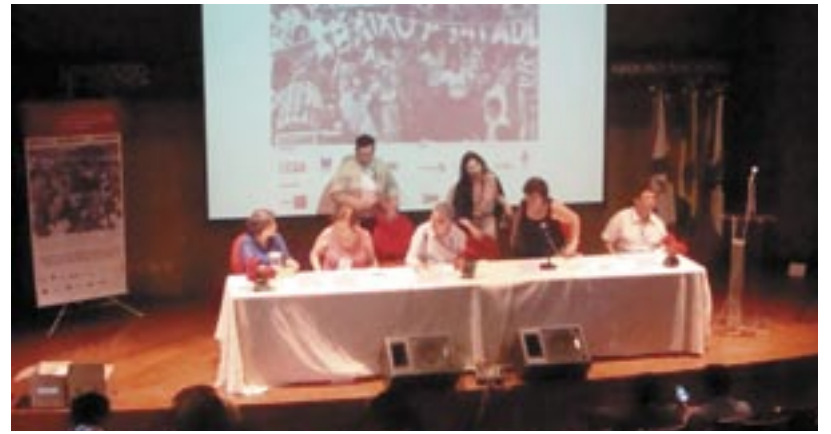
BRASIL: SEMINARIO INTERNACIONAL EL MUNDO DE LOS TRABAJADORES Y SUS ARCHIVOS