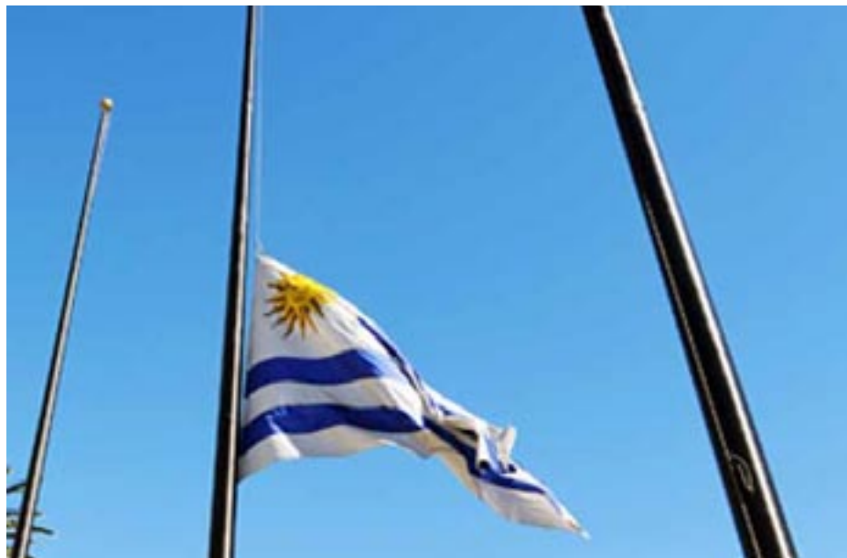
SECRETARÍA DE SALUD LABORAL Y MEDIO AMBIENTE

Admitiendo que podría haber vidas en peligro se debe resaltar el heroísmo de quien arriesga su vida para salvar otras vidas; pero en este caso (y en