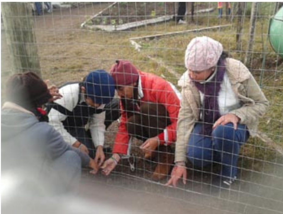
Alumnas y alumnos aprendiendo