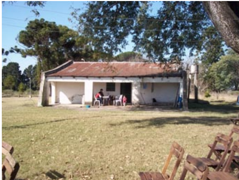
María Elia Topolansky

La administración Pintos (2006-2010) decidió pasar esas tierras y sus instalaciones al Instituto Nacional de Colonización.