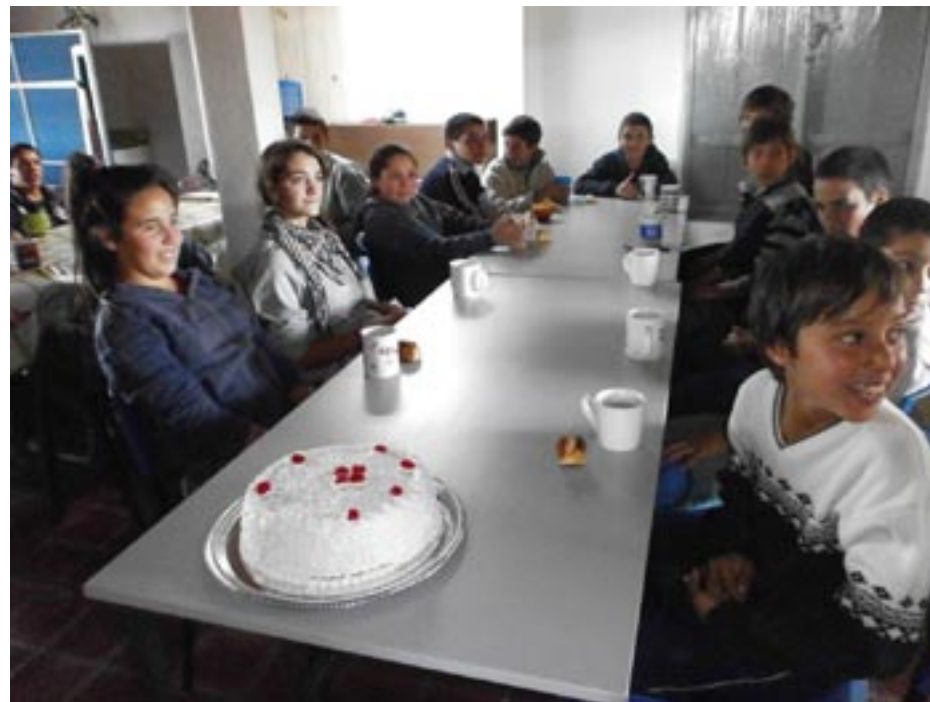
Merendando en la Escuela.

Uruguay (UTU) e instituciones en general para continuar apoyando y mejorando este emprendimiento, que para la zona representa un faro que apunta a la producción rural y al apoyo del productor familiar. Que espacios como este, que se apunta por parte de la comunidad sea un polo de desarrollo en el medio, se creen y fortalezcan en el medio rural es un cambio muy ansiado y necesario para el campo uruguayo.