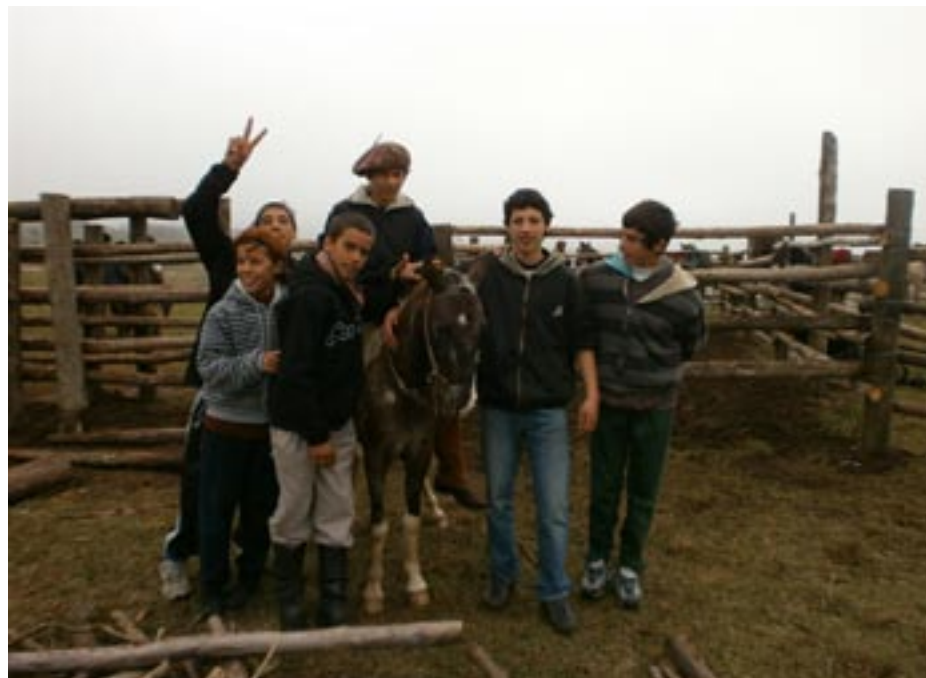
Disfrutando de los animales.

Actualmente se continúa trabajando diariamente junto a la comunidad, a la Universidad del Trabajo de