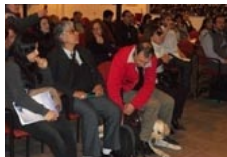
Vista parcial del acto