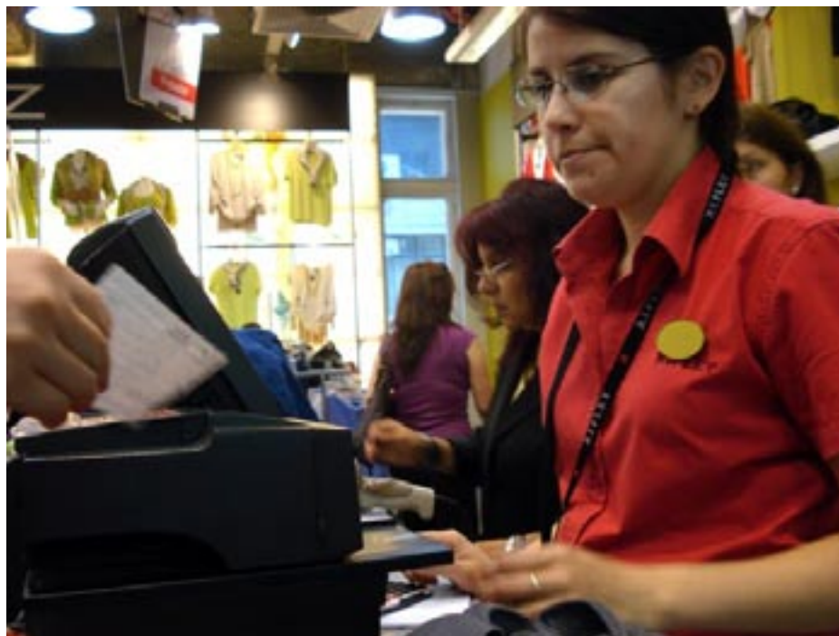
Equipo de Investigación Instituto Cuesta Duarte PIT CNT

Si centramos la mirada en el total de asalariados –trabajadores en relación de dependencia–, en la segunda columna del cuadro I puede observarse que el total con sueldos menores a $ 14.000 asciende a casi 563.000 (47,9% del total), entre los cuales unos 325.000 no alcanzan los $ 10.000 líquidos. Para profundizar en el análisis sobre los salarios sumergidos, un primer corte relevante se vincula a si tienen acceso a cobertura de seguridad social. Entre los no cotizantes (informales), la proporción de trabajadores con salarios menores a $ 14.000 se ubica en 80,5%, lo que significa que 4 de cada 5 percibe salarios sumergidos de acuerdo a esta frontera.