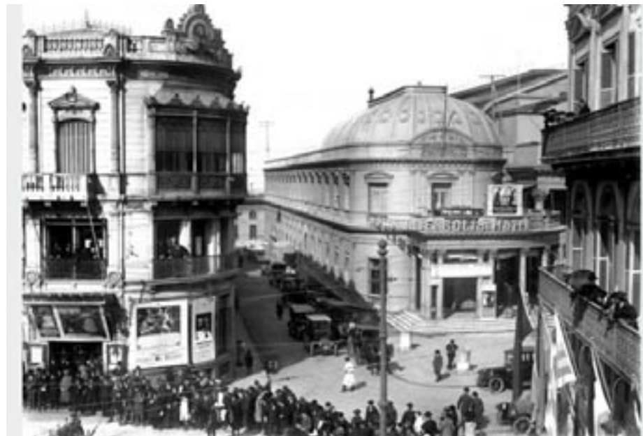
En 1927, poco tiempo antes de invadir el sonido la pantalla grande, las largas colas en el “Cine Ideal” mostraban el prematuro impacto de este espectáculo en la vida de la ciudad. Administrado por la Empresa Casal hnos. de los bajos del Palacete Pons, el “Cine Ideal” -ubicado en la Plaza Independencia 1392 o 702 y Buenos Aires- abrió en mayo de 1908 y cerró en diciembre de 1940.

el “tiempo libre” se vinculó con una variada y renovada gama de actividades y medios disponibles, en general en conexión con el poder de compra del salario y otras con una oferta municipal o estatal que invirtió en parques, las playas y ramblas en el caso montevideano, o las plazas de deporte. Algunas eran “tradicionales” y otras provenían del desarrollo de los nuevos medios masivos de comunicación. Entre estas actividades estaban: los “juegos” (como los de apuestas), las lecturas de publicaciones como diarios y revistas, el impacto de los nuevos medios masivos (el cine y la radio), el baile y los nuevos ritmos (en especial el tango), los centros de sociabilidad como “tabernas” y boliches, los clubes deportivos, las “esquinas” en los barrios.