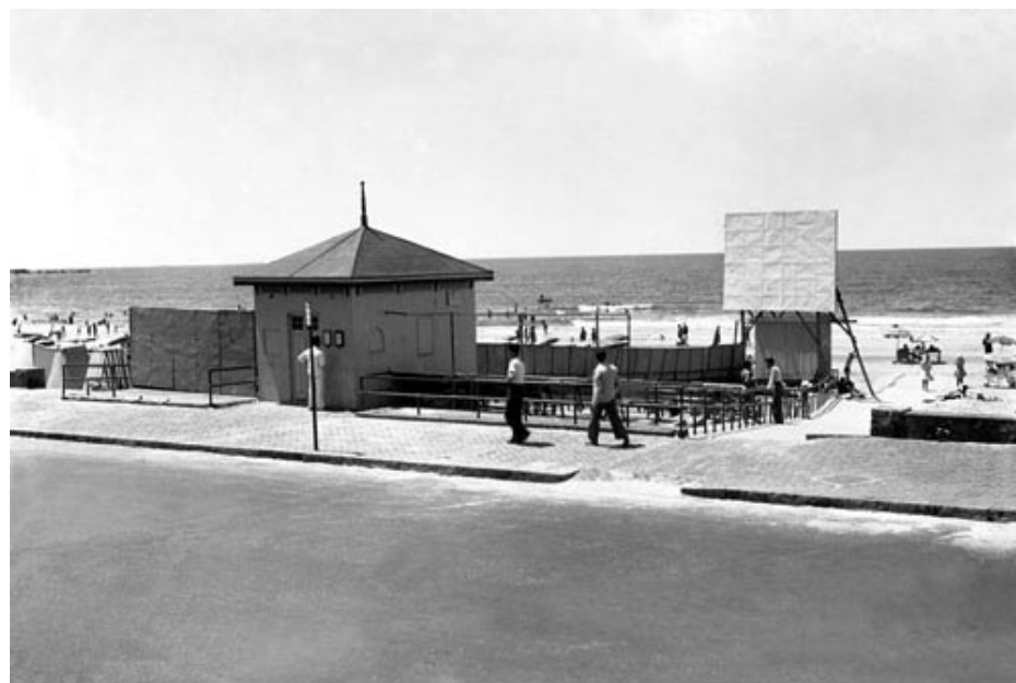
El Club Malvín -inaugurado en 1926- construyó el "Biógrafo o Auditorio Malvín" en 1927, cuya sede funcionó en diferentes lugares a lo largo de su historia. En el verano de 1942 se reabrió este cine con la película "El exilio de Gardel", permitiendo a los vecinos disfrutar del espectáculo cinematográfico al aire libre.

Desde el campo libertario, entre las resoluciones del Tercer Congreso de la anarquista Federación Obrera Regional Uruguaya (FORU) se aconsejaba "a todo el elemento proletario universal la completa abstención del uso del alcohol por considerarlo perjudicial al organismo humano" . 12 Desde una similar orientación, en el órgano de la Sociedad de Resistencia de Obreros Sastres se