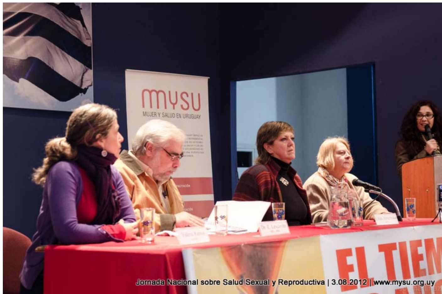
Jornada Nacional sobre Salud Sexual y Reproductiva | 3.08.2012 | www.mysu.org.uy