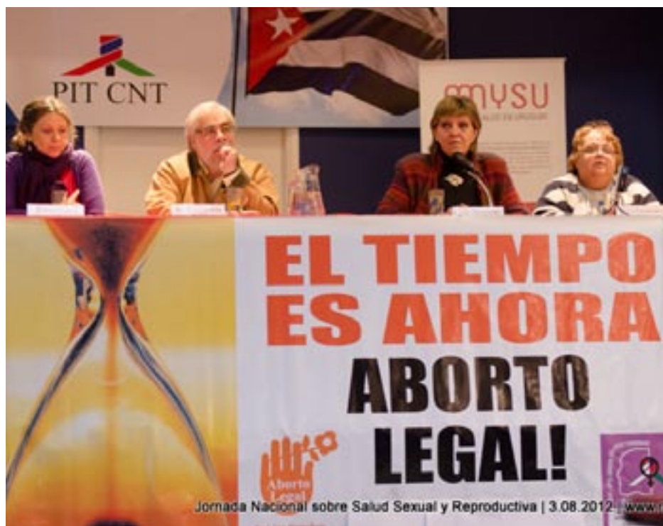
Jornada Nacional sobre Salud Sexual y Reproductiva | 3.08.2012 | www.mysu.org.uy