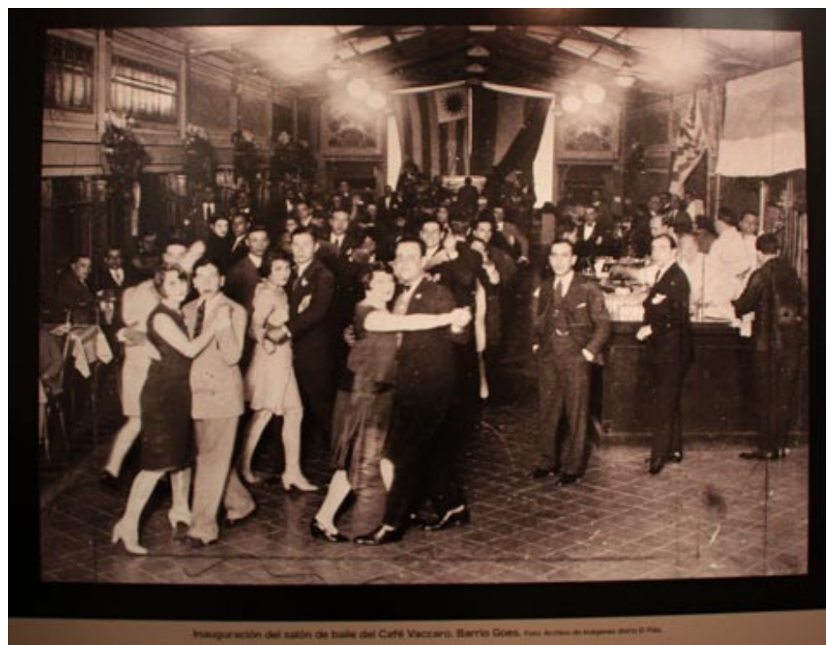
Inauguración del salón de baile del Café Vaccaro - Barrio Goes

"críticas" de las corrientes actuantes en el movimiento obrero sobre actividades que concitaban la atención y el gusto popular.