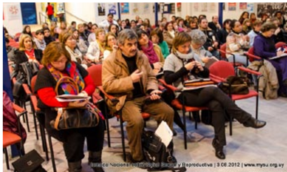
Jornada Nacional sobre Salud Sexual y Reproductiva | 3.08.2012 | www.mysu.org.uy

Esta Jornada fue co-organizada por la Secretaría de Género, Equidad y Diversidad del PIT-CNT en conjunto con Mujer y Salud en Uruguay (MYSU) y con el apoyo del Fondo de Población de las Naciones Unidas (UNFPA), Médicos del Mundo - Francia y OPS-OMS. ■