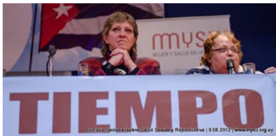
Jornada Nacional sobre Salud Sexual y Reproductiva | 3.08.2012 | www.mysu.org.uy