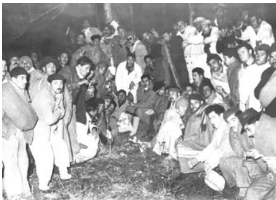
Un alto en la marcha de los trabajadores del Anglo, al finalizar el otoño del 56'.