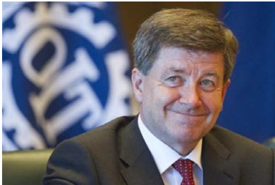
El ex dirigente sindical Guy Ryder asumirá en octubre del 2012 como nuevo Director General de la OIT, en sustitución del actual Director General Juan Somavía, que anunciara la intención de adelantar su partida al 30 de septiembre de 2012, 18 meses antes del final de su tercer mandato.

Finalmente, en el informe elevado, la comisión recomendó a la Conferencia que: 1) solicite al Director General que comunique dichos puntos de vista al Consejo de Administración; y 2) invite al Consejo de Administración a adoptar las medidas adecuadas de seguimiento