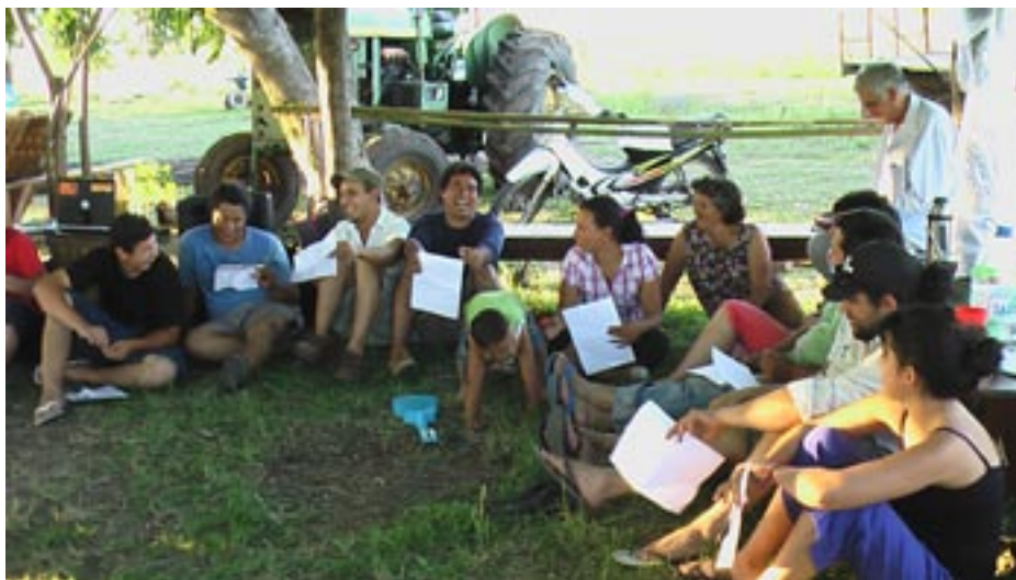
Segundo Campamento de Formación realizado en la chacra escuela del Centro de Formación, en Bella Unión, trabajadores y docentes de Extensión.