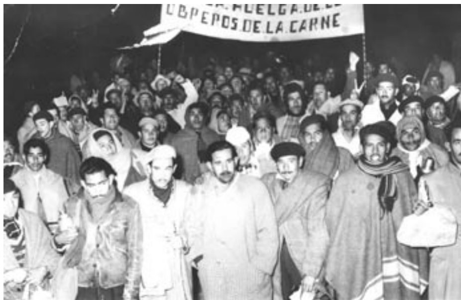
Marcha de trabajadores del Frigorífico Anglo de Fray Bentos a Montevideo en 1956.