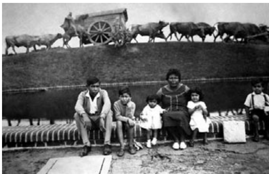
1965-Integrantes de la Marcha de UTAA

Este proyecto ensambla las expresiones plásticas de dos personas que vivieron su adolescencia y juventud