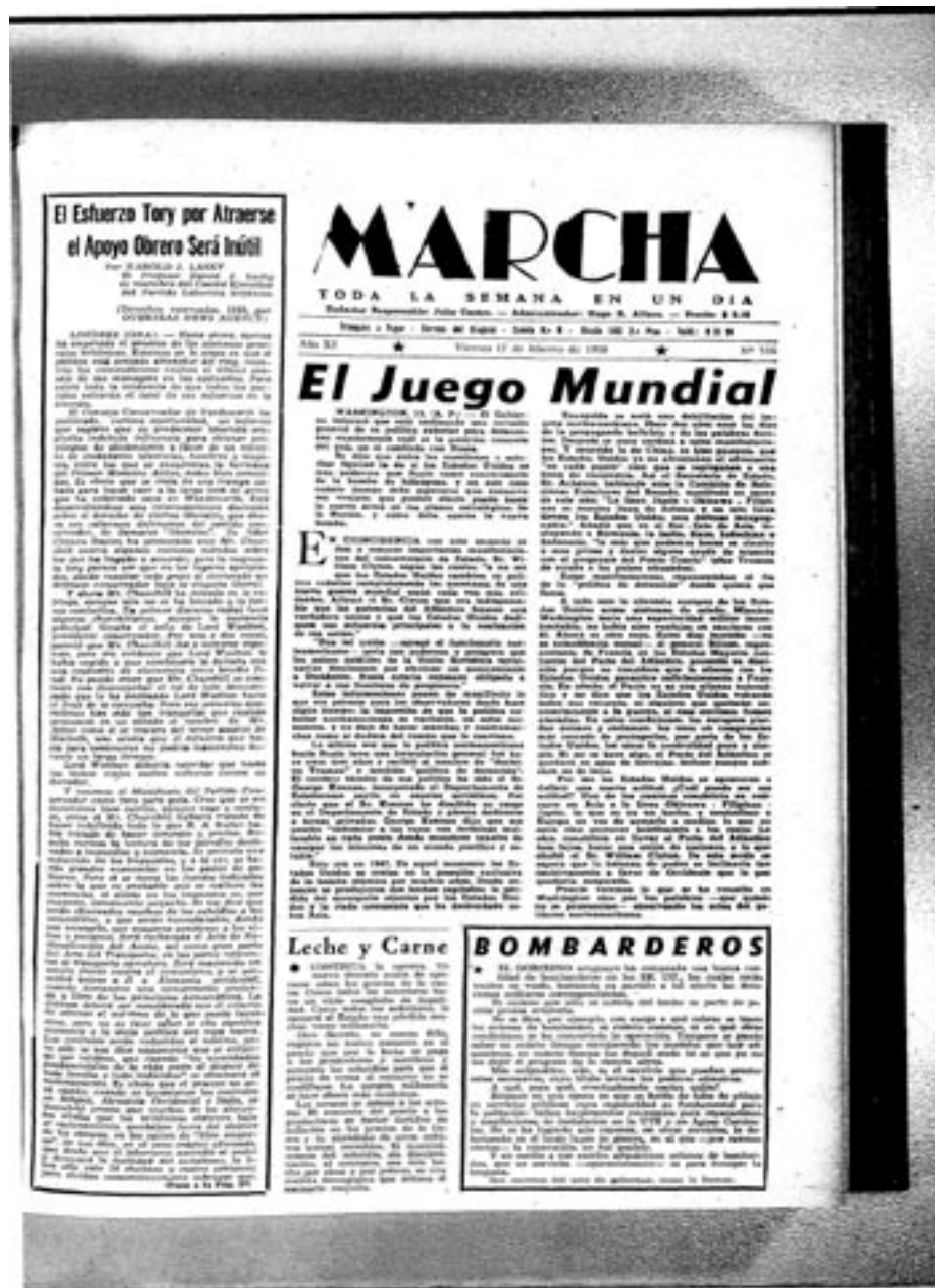
“Marcha”, 17 de febrero de 1950