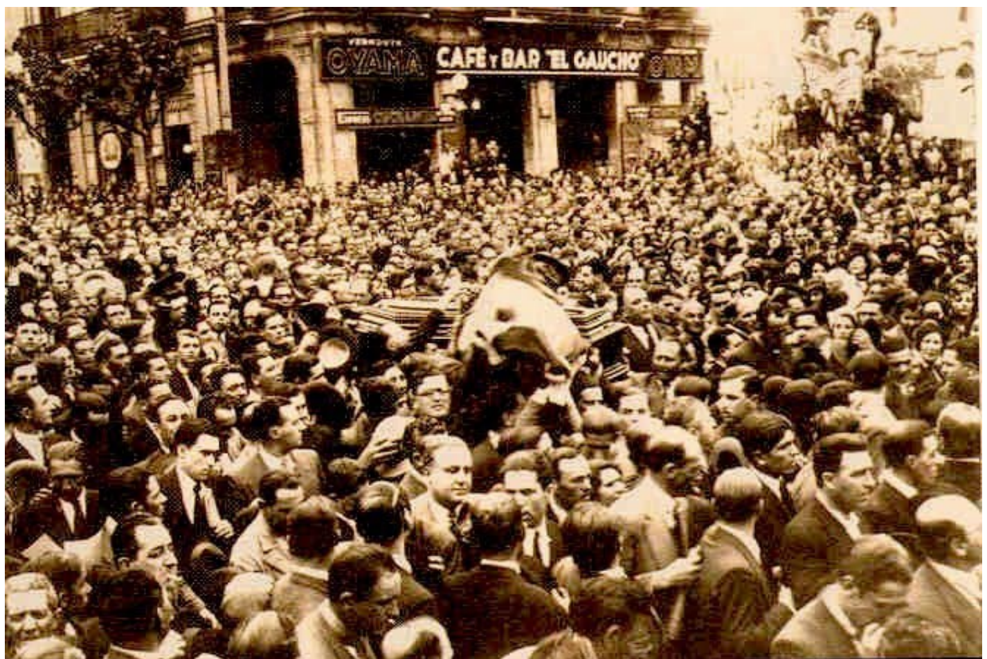
Manifestación en Montevideo en el entierro del dirigente batllista Julio C. Grauert, asesinado durante la dictadura de Terra, 1933.