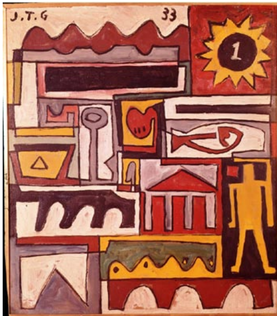
Oficina Regional de la OIT para América Latina y el Caribe

El menor desempleo en Uruguay se explica por la generación